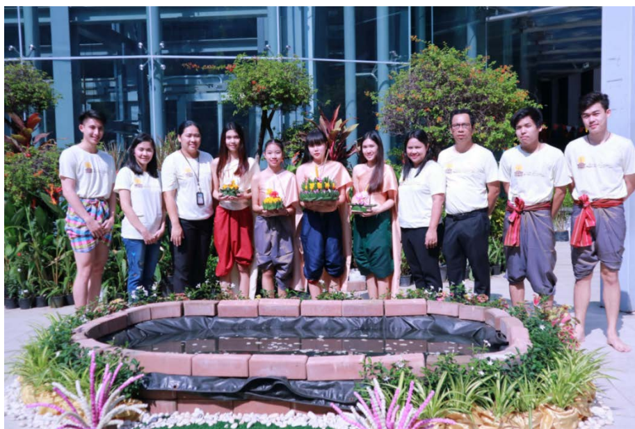
พิธีเปิดงานกิจกรรม