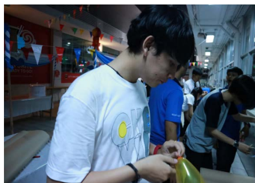
นักศึกษาช่วยกันจัดสถานที่