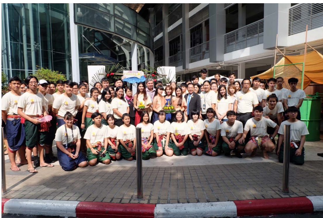
คณาจารย์ นักศึกษา และคณะกรรมการดำเนินงานกิจกรรมถ่ายภาพร่วมกัน