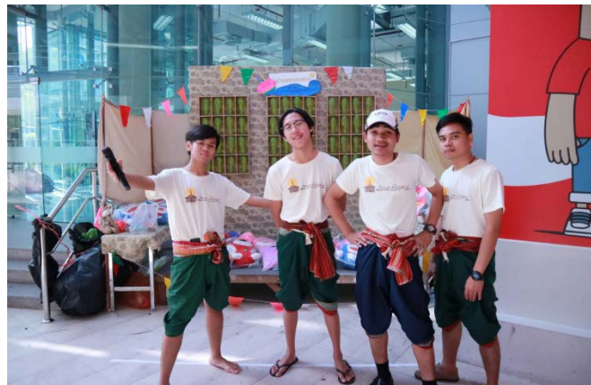
ร้านค้าที่นักศึกษาได้จัดทำขึ้น