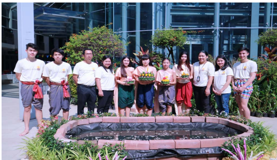
หลักสูตรบริหารธุรกิจบัณฑิต สาขาวิชาคอมพิวเตอร์ธุรกิจ คณะวิทยาการจัดการ