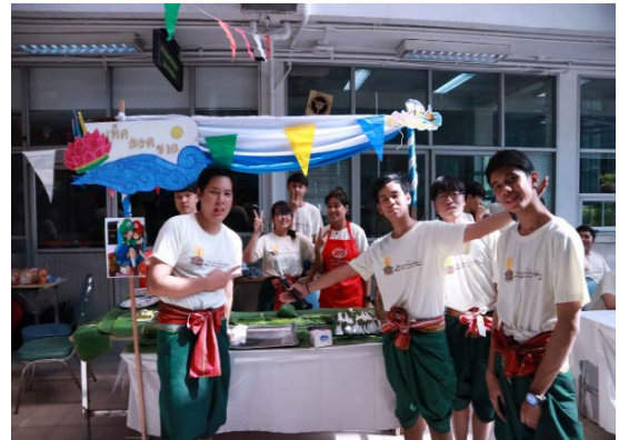
ร้านค้าที่นักศึกษาได้จัดทำขึ้น