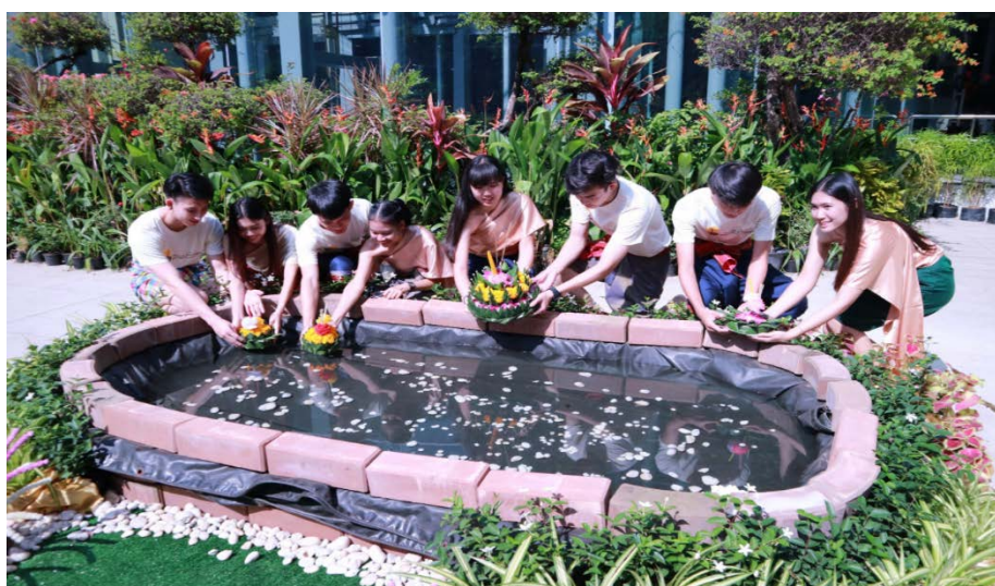
คู่ชายหญิงลอยกระทงในสระที่จำลองขึ้นมา