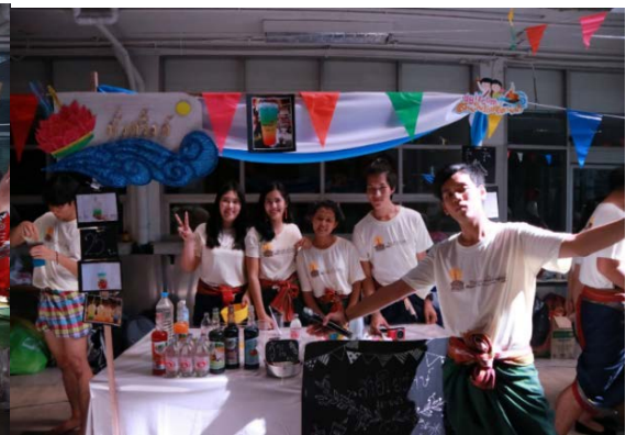
ร้านค้าที่นักศึกษาได้จัดทำขึ้น