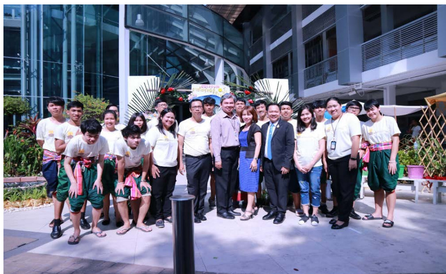
คณะกรรมการที่ดำเนินกิจกรรมพร้อมกันักศึกษา